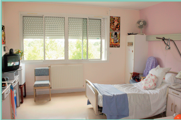
Photo d'une chambre EHPAD Site Nouvelle