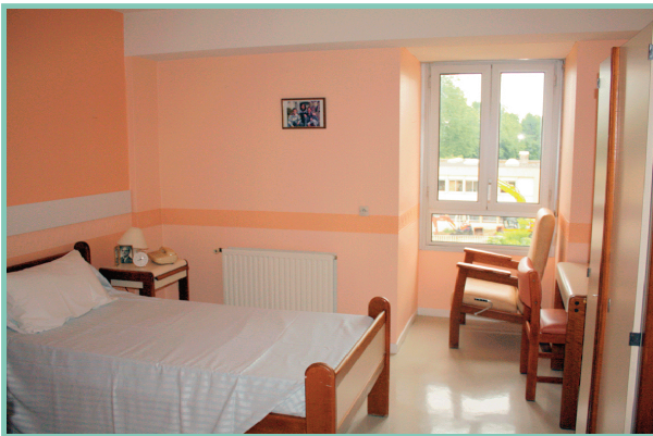
Photo d'une chambre MAISON DE RETRAITE LESBAZEILLES