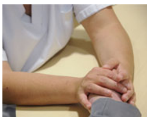
Votre hôpital s'engage

Equipement, nouvelles activités, travaux... Votre hôpital s'inscrit dans l'avenir