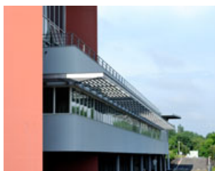
Votre hôpital avance

Equipement, nouvelles activités, travaux... Votre hôpital s'inscrit dans l'avenir