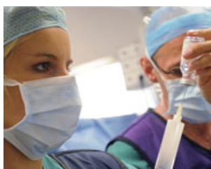
Votre hôpital recrute

Formation initiale, formation continue, CESU, ... l'hôpital s'inscrit dans une démarche volontariste