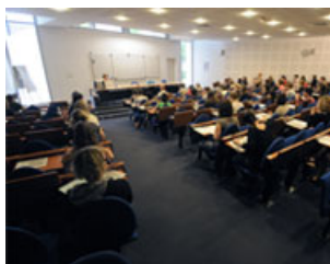
Votre hôpital forme

Qualité et sécurité de votre prise en charge, un défi relevé par tous nos agents