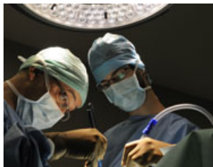
Votre hôpital en images